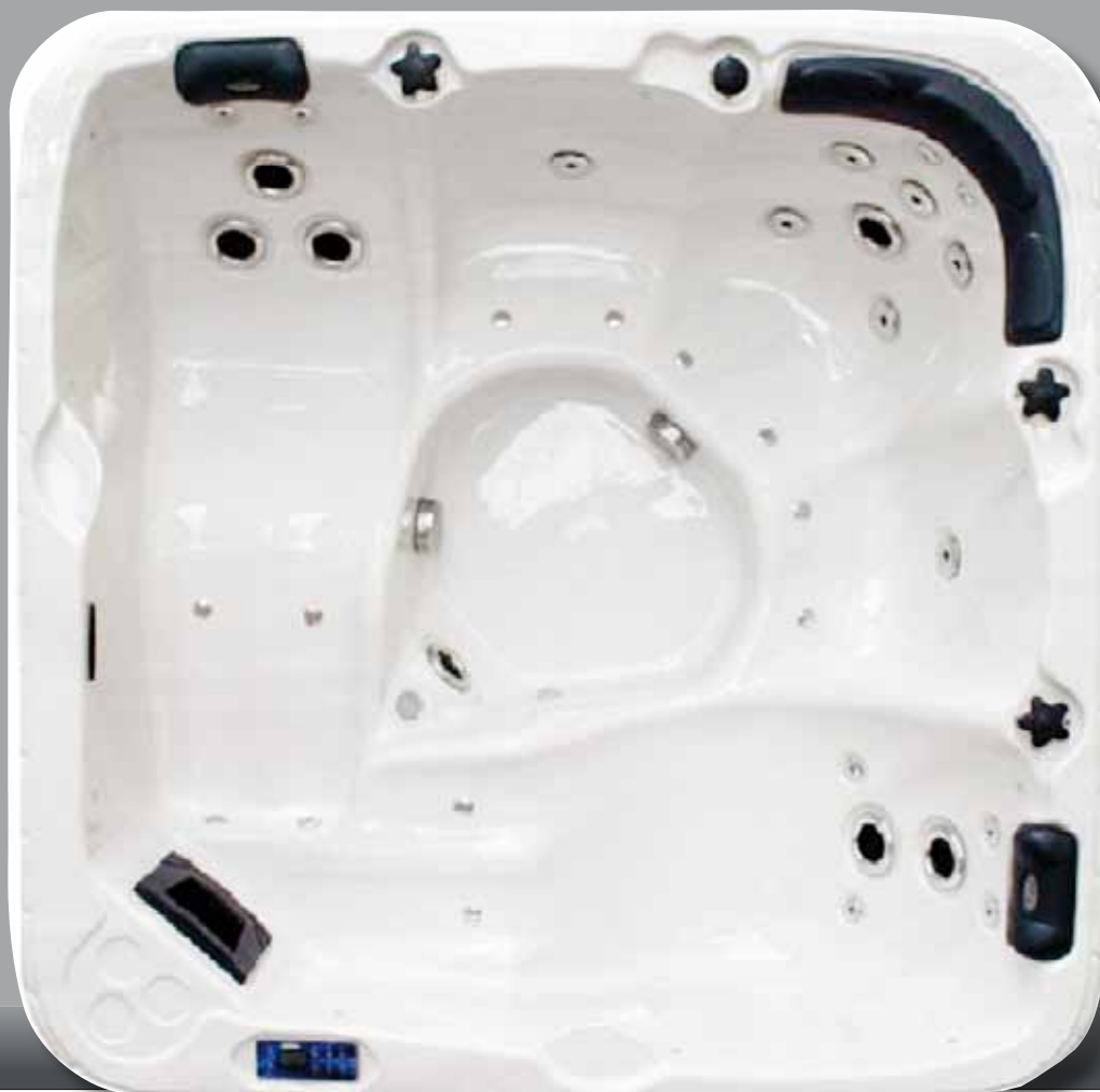
Abbildung: Monaco II